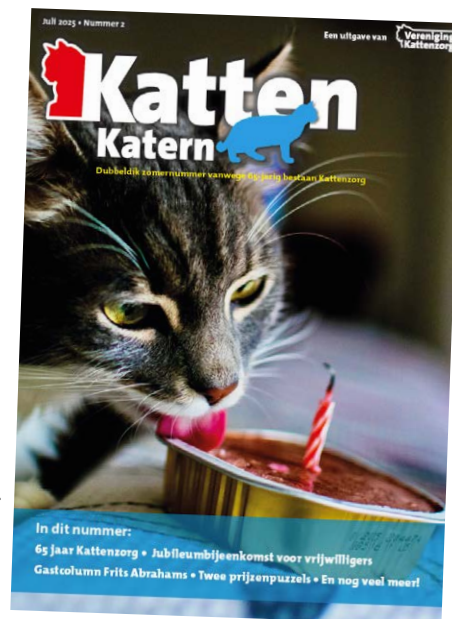
De cover van het dubbeldikke jubileumnummer.