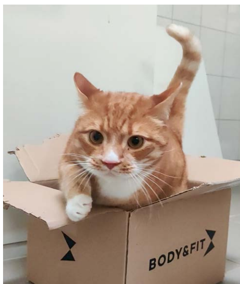
Sponsorkat Harvey gedraagt zich keurig mits hij op tijd zijn eten krijgt!

Er zijn in 2025 in totaal 1.835 verzorgingen genoteerd, uitgevoerd door alle verzorgers bij elkaar. Wat opvalt, is dat er meer dan in vorige jaren sprake was van zogenaamde sociale verzorgingen. Als de eigenaar plotseling een poosje niet meer voor de kat kan zorgen, weten instanties Kattenzorg goed te vinden.